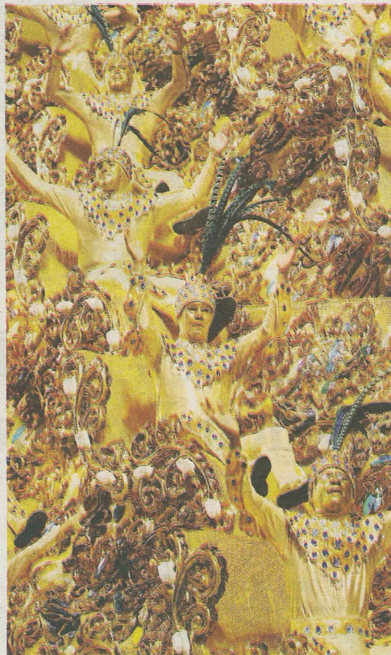
Gold – Ausdruck von Wohlstand und Reichtum.